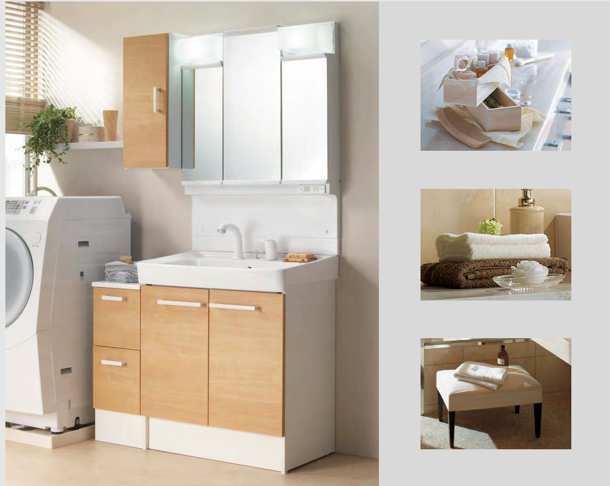
写真はイメージです。見積内容とは異なります。